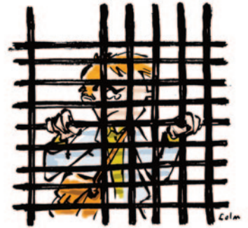
ÉVALUATION DES ENSEIGNANTS : LA GRILLE

Elles ouvrent la voie à toutes formes de pressions et s'inscrivent pleinement dans l'accompagnement permanent PPCR qui vise à transformer des enseignants titulaires en « stagiaires à vie » et à exercer sur eux une pression permanente ! ■